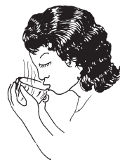
椴树茶是缓解焦虑的天然饮品。

很多补品都有舒缓和平衡身心的作用，但其中一些可能弊大于利。不要轻信那些吹得天花乱坠且价格昂贵的补品——它们往往是无效的。