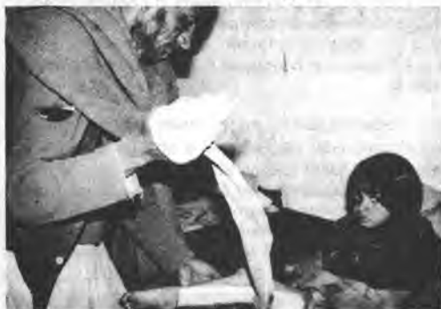
Наложение шины на ногу для исправления контрактуры коленного сустава.