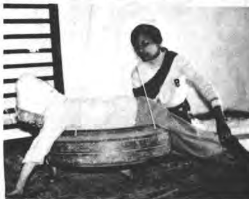
Помощь ребенку, начинающему учиться двигаться.

С 1984 г. начались регулярные двенадцатиминутные радиопередачи по проблемам домашней реабилитации. Кроме того, эта программа подыскивает подходящие кустарные производства, овладев которыми молодые люди могли бы материально помогать своим семьям, готовит руководства по таким производствам (примеры см. на с. 510).