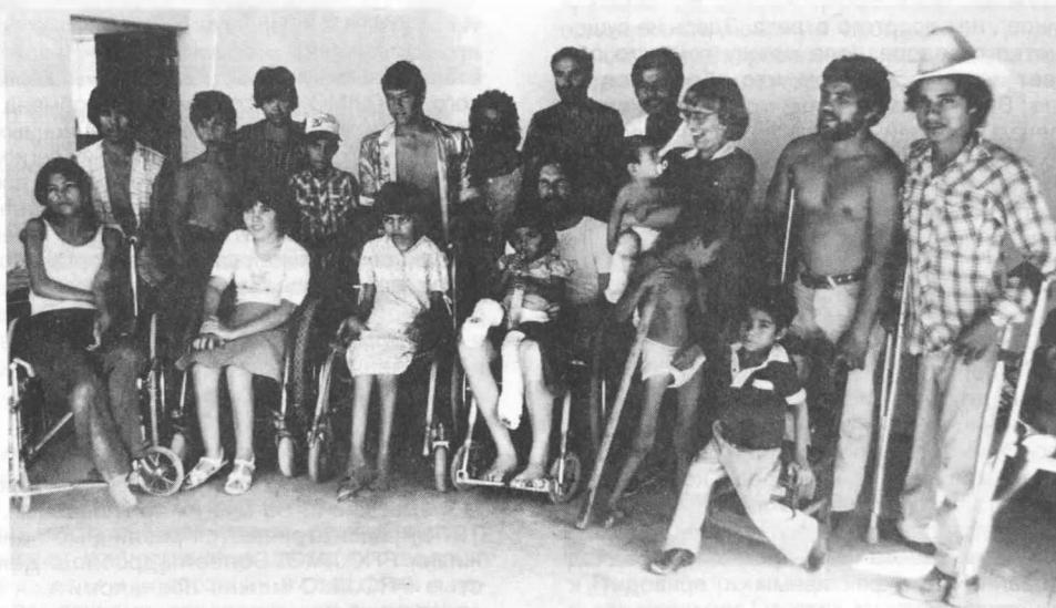
Группа работников PROJIMO

Располагаясь в небольшой деревушке, PROJIMO обслуживает семьи с детьми из всех окрестных сел и деревень и даже из ближайших городов (в радиусе до 100 миль). Местные жители участвуют в программе, принимая приезжающих детей-инвалидов и членов их семей в своих домах. Школьники помогли построить спортивно-игровую площадку для всех детей, делают игрушки для детей-инвалидов.