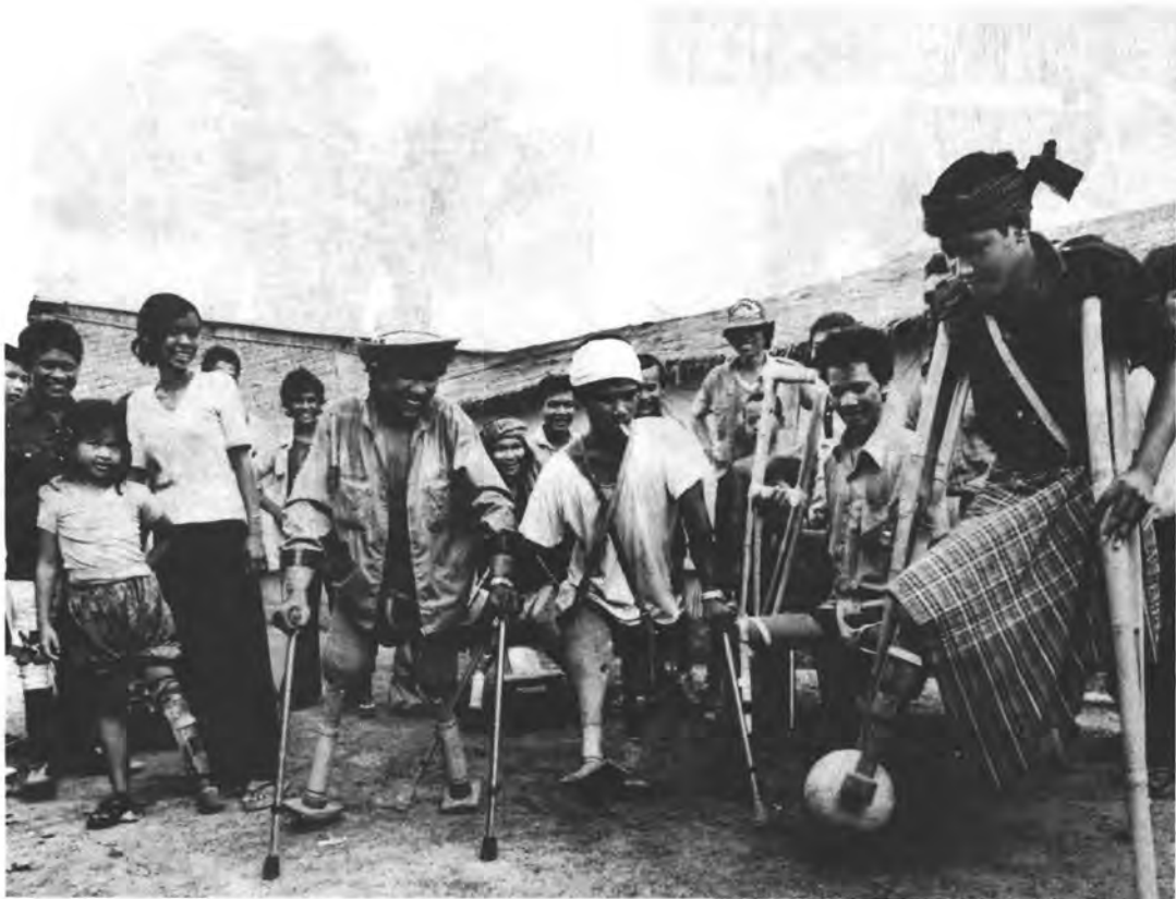
Приспособления для жизни (АНРТАГ)

Напряженная работа и атмосфера дружеской поддержки, царящая в мастерских, помогают многим вернуться к жизни.