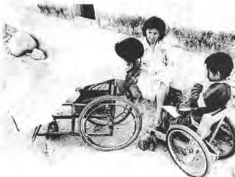
Дополнительная помощь наставника.