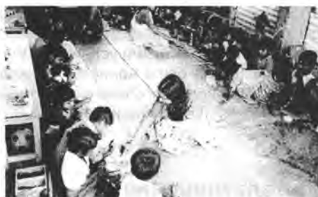
Дети с замедленным развитием проходят обучение по дошкольной программе (Индия, около Бангалора).

Например, мы знаем одного мальчика с расщелиной позвоночника, страдающего недержанием кала, из-за чего он никогда не посещал школу. Но после того, как его родители поговорили с учителем и учениками, было достигнуто понимание. В настоящее время этот мальчик ходит в школу. Когда происходит непроизвольное опорожнение кишечника, он быстро встает и идет домой помыться и переодеться. (К счастью, его дом расположен рядом со школой.)