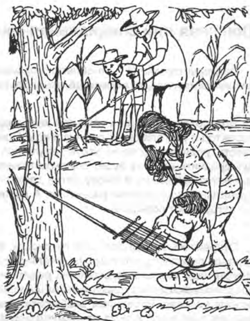
Многие дети в сельской местности основное воспитание получают не в школе.

Ребенок может быть более счастливым и приобрести больше необходимых для жизни навыков, помогая отцу в поле или матери на базаре, нежели посещая школу.