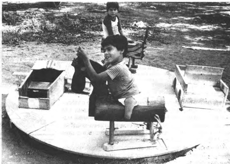
и на отдыхе.