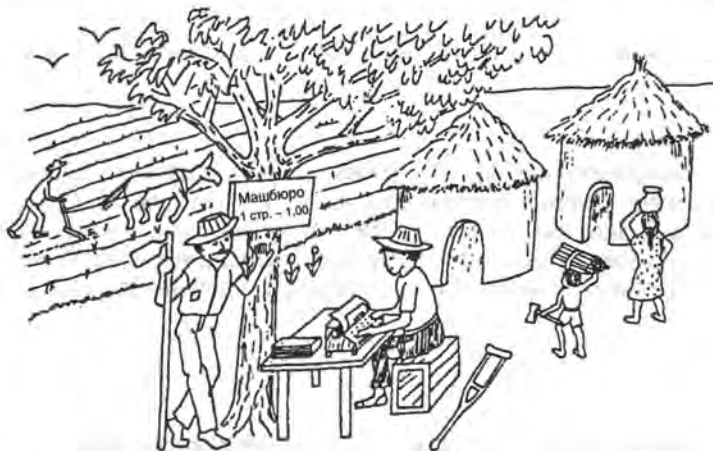
В деревне знания, приобретенные в школе, для инвалида могут быть более необходимы, чем для здорового человека.

Для деревенских детей с физическими недостатками посещение школы может быть даже важнее, чем для здоровых детей. Они часто не в состоянии выполнять тяжелую крестьянскую работу, которая по силам здоровым детям. Поэтому им нужно прививать навыки для интеллектуального труда, чтобы они могли приносить пользу обществу. Им, по возможности, следует помогать посещать школу.