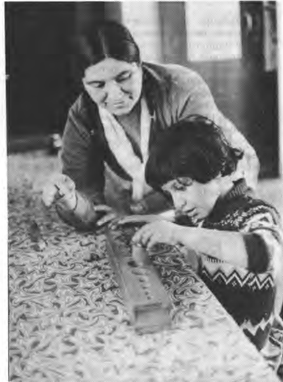
Одно из наиболее эффективных средств помочь ребенку овладеть новым навыком – с большим вниманием отнестись к его занятию, всячески подбадривая и похваливая.

Описанный бихевиористский подход к воспитанию ребенка и привитию ему необходимых навыков аналогичен системе, именуемой “бихевиористской терапией”, или “бихевиористской модификацией”. Авторы считают, что важнее улучшить общение ребенка с окружающим миром, помочь ему понять этот мир. Следует не столько “изменить поведение ребенка”, сколько помочь ему усвоить порядок вещей, чтобы подопечный добровольно выбрал манеру поведения, более приемлемую для окружающих*. Для этого родителям надо прежде всего научиться оценивать и менять свои собственные действия по отношению к ребенку. Им следует искать стиль общения с ребенком, характеризующийся логической последовательностью, доброжелательностью и стимулированием хорошего поведения.