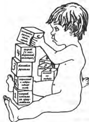
Способности ребенка развиваются одна за другой, как башенка, которую строят из кубиков.

На первом году жизни ребенок обычно все лучше овладевает своим телом. Навыки владения телом развиваются постепенно, начиная от головы и распространяясь вниз: