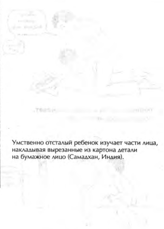
Умственно отсталый ребенок изучает части лица, накладывая вырезанные из картона детали на бумажное лицо (Самадхан, Индия).

Тут же ребенок изучает части лица, накладывая вырезанные из картона детали на бумажное лицо (Самадхан, Индия).