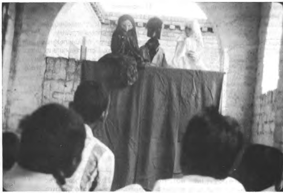
В Самадхане (Индия) для обучения умственно отсталых детей используют кукольный театр. На каждой кукле одежда определенного цвета, а именем ей служит название этого цвета. Запоминая имена кукол, дети начинают усваивать цвета.