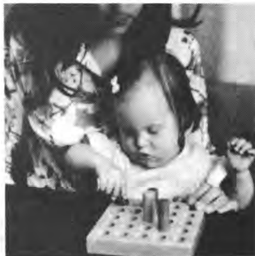
Девочка с болезнью Дауна учится вынимать колышки из дощечки. Позже она научится вставлять колышки (Фото из книги Teaching Your Down's Syndrome Infant ("Обучение ребенка с болезнью Дауна").)