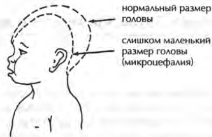
Ребенок с микроцефалией (слишком маленьким мозгом) отстает в умственном развитии, у него часто возникают некоторые физические отклонения. Об измерениях размера головы см. с. 41.

Во многих районах мира частыми причинами умственной отсталости являются повреждение мозга и болезнь Дауна. В некоторых горных местностях она вызывается недостатком йода в пище и воде (с. 282).