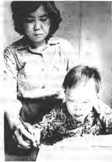
При необходимой помощи некоторые умственно отсталые дети могут научиться читать, писать и многое из того, что делают нормальные дети. (Ребенок с болезнью Дауна в Индонезии.)

ВАЖНО! В этой главе мы рассматриваем некоторые из причин умственной отсталости и вкратце описываем две ее распространенные формы – болезнь Дауна и кретинизм . Однако умственная отсталость является лишь одной из причин замедленного развития у детей. Слепой ребенок позже начнет тянуться к предметам и двигаться, если только ему не оказать дополнительную помощь и поддержку. У глухого ребенка будет наблюдаться задержка в развитии навыков общения, если не научить его “разговаривать” другими способами, отличными от устной речи. У ребенка с тяжелым физическим недостатком часто запаздывает физическое и умственное развитие. Поскольку “задержка в развитии” широко встречается при очень многих физических недостатках, мы посвятим ей несколько глав.