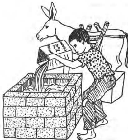
В одной деревне молодой человек с болезнью Дауна работает водовозом – возит воду с речки. Он счастлив и горд своей работой.

ВАЖНО! О воспитании ребенка с болезнью Дауна или с замедленным умственным развитием обязательно прочтите все главы, посвященные раннему развитию ребенка и освоению основных навыков (гл. 33–41).