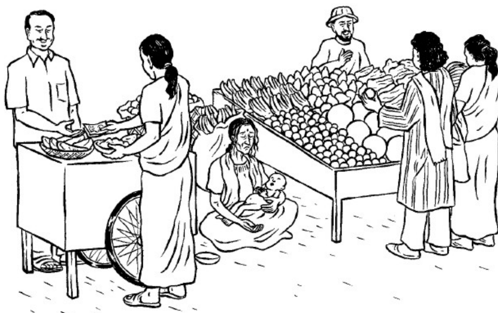
Голод вызван недостатком продовольствия. Недостаток продовольствия вызван недостатком справедливости.

Во многих местах люди лишились традиционных знаний о производстве продуктов питания. А из-за быстро меняющихся условий, таких как перенаселенные общины, меньше плодородной земли, и меняющаяся погода, старые методы больше не действуют. Когда люди не знают, как производить еду, результатом являются голод и отсутствие продовольственной безопасности. Одним из решений проблемы является поддержание, передача и улучшение знаний через полевые школы фермеров, программы обучения фермеров фермерами и службы пропаганды сельского хозяйства. (см. стр. 316 и Ресурсы)