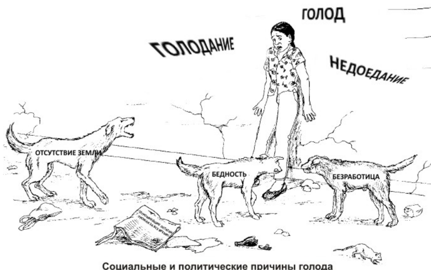
Социальные и политические причины голода

Голод может быть вызван многими причинами, такими как плохая почва, изменения в климате, отсутствие доступа к воде и так далее. Но во многих общинах, голод также вызван бедностью. Когда у фермеров мало или нет дохода, или когда мало денег для покупки продовольствия, люди голодают. Чтобы понять основные причины бедности и голода в одной общине, очень полезно взглянуть на проблемы продовольственной безопасности, которые влияют на каждую общину.