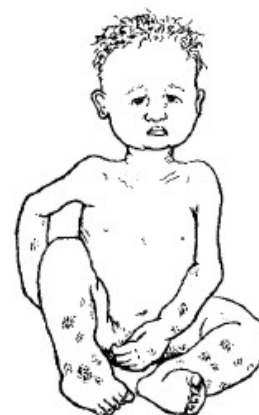
Жидкое истощение: этот ребенок только кожа, кости и вода.

Плохо питающиеся дети растут медленно и плохо учатся в школе, или слишком слабы, чтобы посещать школу. Плохое питание, в частности, является проблемой маленьких детей и должна лечиться сразу. Чтобы узнать больше об этих проблемах со здоровьем и о том, как хорошее питание может предотвратить их, посмотрите книгу по общей медицине Там, Где Нет Доктора .