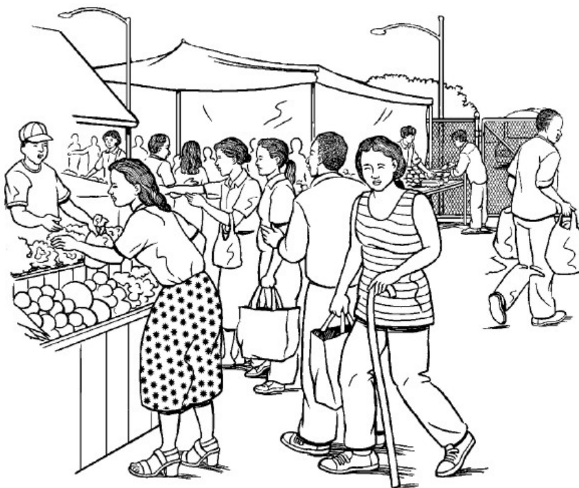
Местная еда здоровее, свежее и поддерживает местную культуру и экономику.

Но даже с правительственной поддержкой и без нее существует много способов улучшить продовольственную безопасность. От посадки маленького сада до создания фермерского рынка, изменения, улучшающие продовольственную безопасность, часто могут быстро дать результаты и мотивировать людей создавать больше.