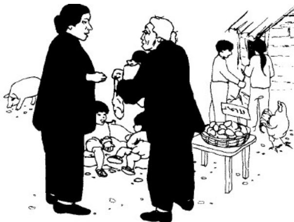
Продовольственные программы сообщества поддерживают культуру в сельском хозяйстве.

Продовольственная безопасность наиболее крепка, когда еда производится и распространяется локально. Местная выращенная еда свежее и более питательна. Она создает локальную экономику, в то время как деньги передвигаются по кругу к фермерам и бизнесу в этих местах. И она также помогает строить отношения между людьми, делая общины сильнее и места обитания более здоровыми. Так как у бедных населения часто бывает мало земли и мало продовольственных рынков, обретение контроля над производством и распределением продовольствия является особенно важным для них.